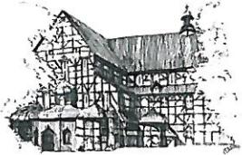
Kościół Pokoju pw. Św. Trójcy Wpisany na listę UNESCO