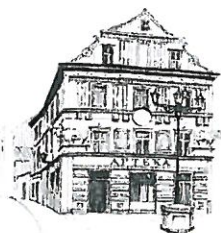
Kamienica „Pod Bykami”